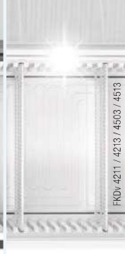
FKDv 4211 / 4213 / 4503 / 4513