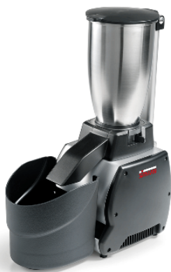
Sirman Измельчители льда , model Nordkapp :

Sirman Spa Viale dell'Industria 9/11 35010 PIEVE DI CURTAROLO (PD), Italy Tel./Fax. +39 049 9698666 / +39 049 9698688 email: info@sirman.com