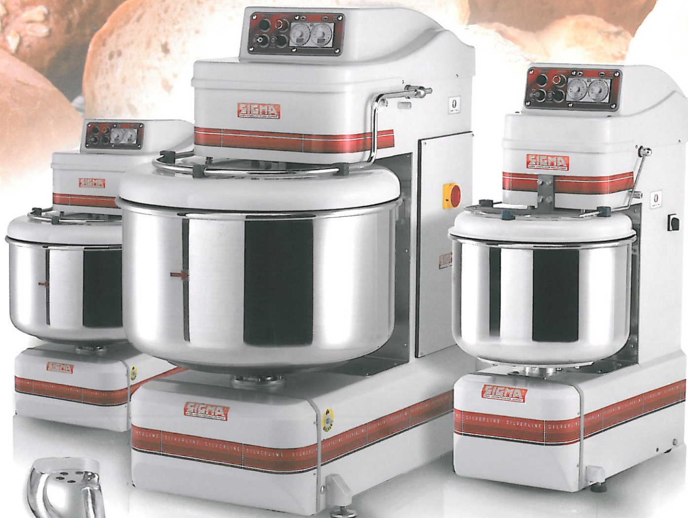
versione con timer