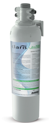
Головная часть продается отдельно

Clariss Ultra 1500-XL картридж фильтра: EV4339-83