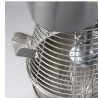
Feed tray for add ingredients