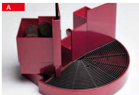
A cassetto raccogli fondi grounds container

VERSATILITY AND FUNCTIONALITY VERSATILITÉ ET FONCTIONNALITÉ