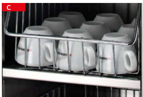
C scaldatasse cup warmer