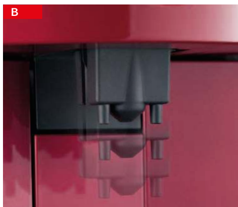
B becco erogatore regolabile adjustable wand