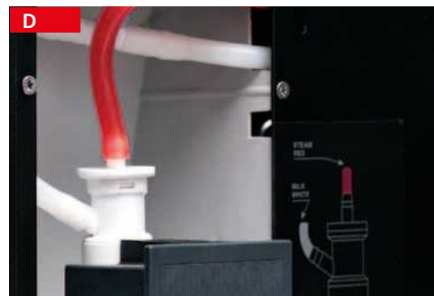
cappuccinatore incorporato in-built cappuccino maker