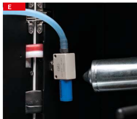
regolatore densità latte milk density regulator