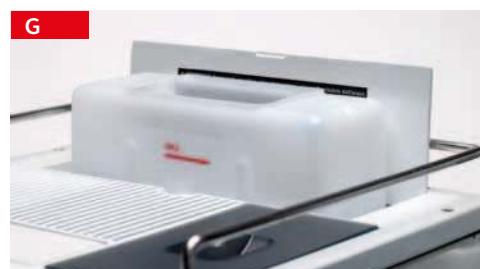
tanica da 5lt o attacco diretto 5Lt tank or mains connection