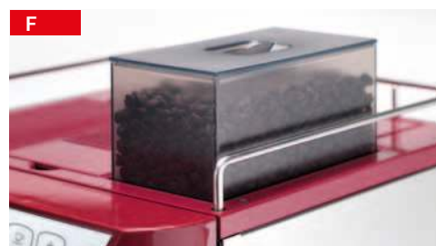
extra-sylos caffè extra coffee container