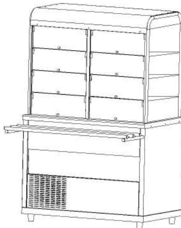
Рис.1 Общий вид СОЭП-В/ЛП, СОЭП-В/ЛПЭ.

Общий вид стола охлаждаемого с витриной представлен на рис. 1. В серии «Лира-Профи» корпус охлаждаемого стола изготовлен из нержавеющей стали, в серии «Лира-Профи Эко» отдельные элементы изготовлены из окрашенной оцинкованной стали. Состоит из основания, к которому крепятся передняя и боковые облицовки. Сверху корпус накрыт плоской столешницей из нержавеющей стали. Корпус разделен на два отсека – агрегатный и основной. В агрегатном отсеке размещается компрессор, конденсатор и элементы монтажа холодильной установки. Основной отсек может использоваться для хранения инвентаря. Объем этого отсека не охлаждается. Над столешницей расположена охлаждаемая витрина с тремя рядами перфорированных нержавеющей стали полок для демонстрации и раздачи блюд. Поднимающиеся дверки витрины со стороны потребителя, выполнены из оргстекла и обеспечивают удобное извлечение блюд из нее. Со стороны обслуживающего персонала установлены раздвижные оргстеклянные дверки. Внутри витрины находится светодиодная подсветка. В верхней части витрины находится воздухоохладитель и монтажные элементы холодильной установки. Столешница «СОЭП-В/ЛП-1500» и «СОЭП-В/ЛПЭ-1500» дополнительно оснащена испарителем в столешнице. Под агрегатным отсеком установлен поддон для сбора конденсата после оттаивания испарителя. Со стороны потребителя на стол охлаждаемый устанавливаются направляющие для подносов. Высота стола охлаждаемого регулируется опорами.