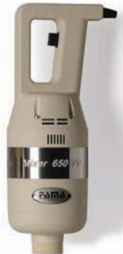
MIXER 650 VV