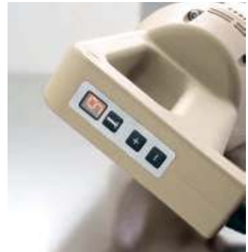
Regolatore a 9 velocità con display luminoso Luminous display with 9 speeds regulator

FSP Supporto pentola regolabile e con snodo libero Adjustable pot support with free articulated joint