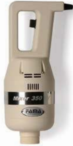
MIXER 350 VV

La tecnologia SRS consente di ottenere composti estremamente omogenei. SRS device grants high-quality homogeneous mixtures.