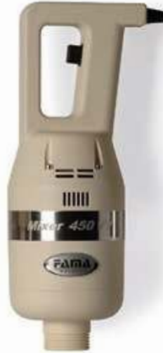
MIXER 450 VV