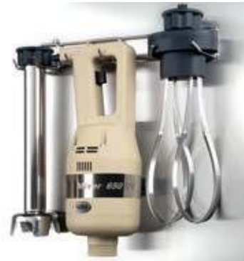
FSPC Support parete Wall support