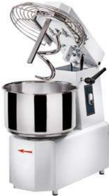
mod. TSV con testa sollevabile e vasca estraibile mod. TSV with liftable head and removable bowl mod. TSV avec tête soulevable et cuve amovible mod. TSV con cabeza levantable y recipiente extraible

spiral mixer with liftable head pétrin à tête soulevable amasadora con cabeza abatible