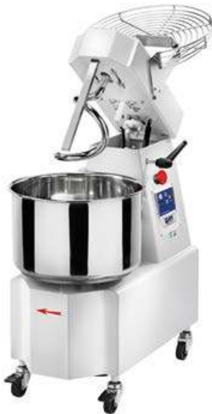
versione con pulsantiera digitale e ruote version with digital panel and wheels version avec panneau numérique et roues versión con teclado digital y ruedas