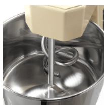
S/S bowl and shaft