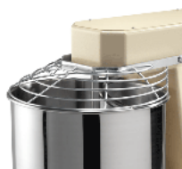
Grill cover optional