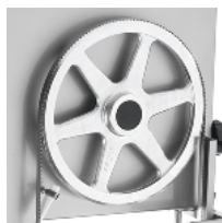
Hermetic upper pulley