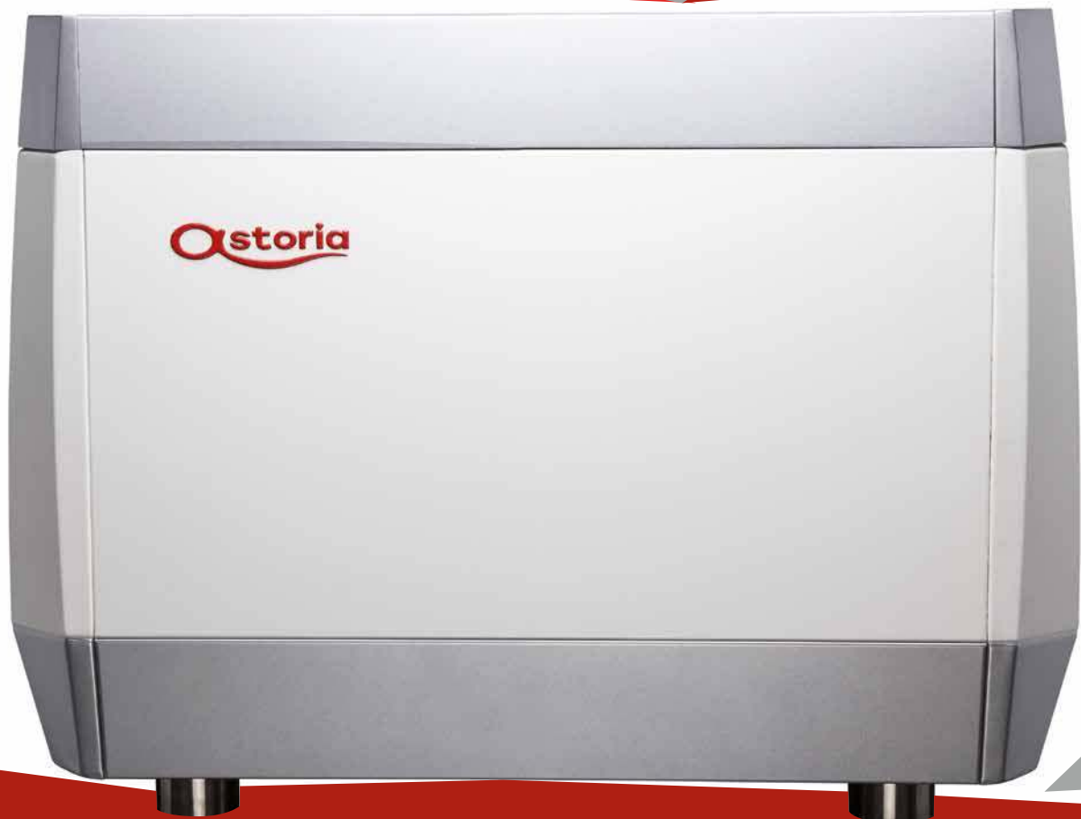
SAE TS | Electronic Automatic System - Touch Screen